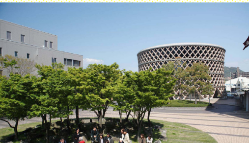
Главный кампус (Хиросима)

Смотрите английскую версию домашней страницы для более подробной информации.